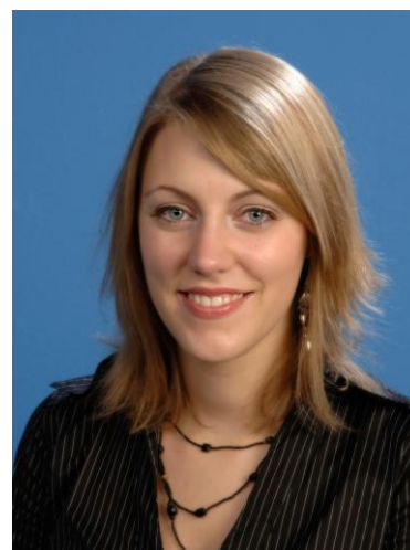
mit Weichzeichnung in zwei Ebenen ohne Augen und Mund

Vor dem Speichern als JPG müssen alle Ebenen auf die sichtbare Ebene reduziert werden – Umschalt+Strg+E