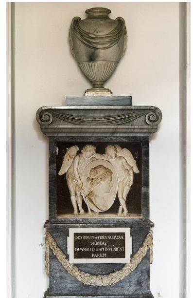
Nur ein Grabmal der Familie von Béguelin im Eingangsbereich erinnert noch an die Familiengruft von 1789.