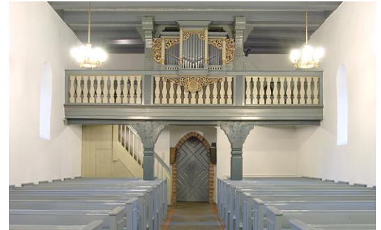
Die Schuke-Orgel der Dorfkirche von 1941.

Die Döberitzer Kirche wurde 1895 in einen Truppenübungsplatz einbezogen.