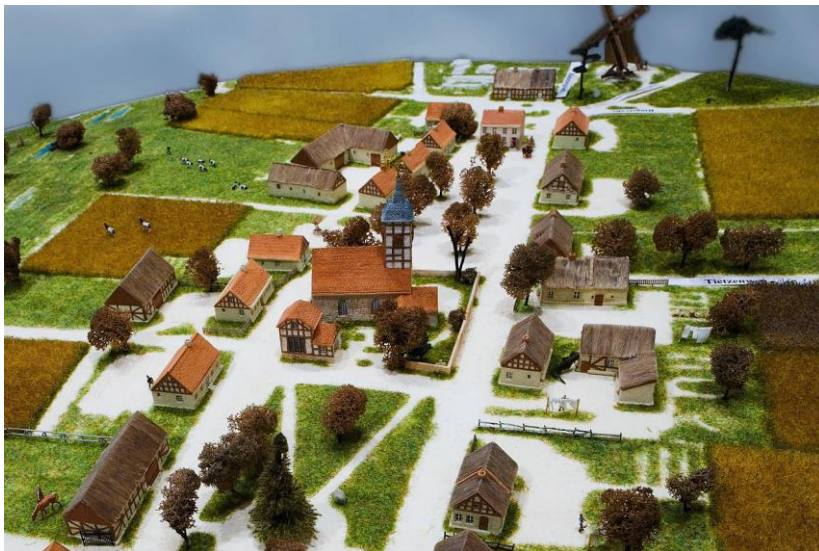
Die Lichterfelder Dorfaue um 1850.

2000 wurde der Kirchturm saniert, dabei wurden auch giftige Holzschutzmittel entfernt.