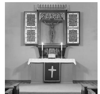
Der Altar aus Döberitz stand von 1941 bis 1993 in der Dorfkirche.

Blick von Norden (Steglitz) nach Süden. Links vor der Kirche steht das Spritzenhaus.