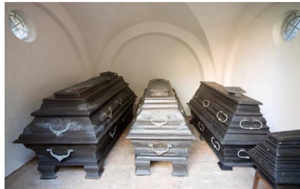
Die Gruft der Familie von Bülow befindet sich auf der Nordseite der Kirche.